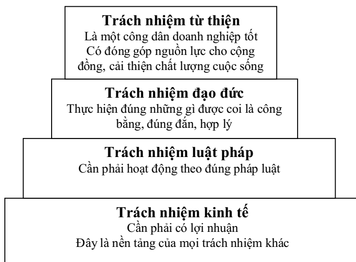
Hình 1: Tháp trách nhiệm xã hội doanh nghiệp

Qua thời gian, có nhiều học giả đưa ra những định nghĩa liên quan tới trách nhiệm xã hội của doanh nghiệp, và tất nhiên, không có một định nghĩa nào được coi là hoàn hảo. Ở một khía cạnh nhất định, tác giả nhận thấy định nghĩa hợp lý và rõ ràng nhất là của Maignan, Ferrell và Hult (1999). Về cơ bản, định nghĩa này vẫn kế thừa ý tưởng từ Carroll,